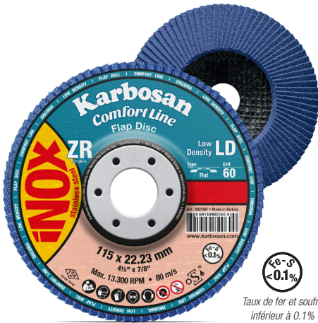
Taux de fer et soufre inférieur à 0.1%